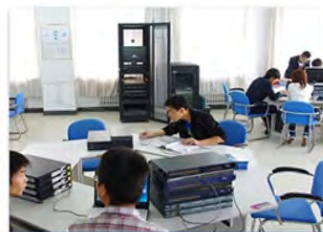
Installation et réparation d'équipement de télécommunications 通讯设备安装与维修