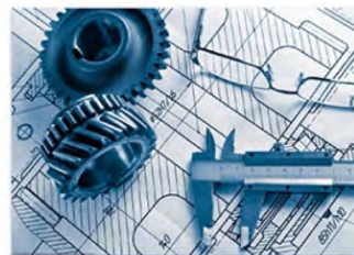
Dessin industriel 工业制图