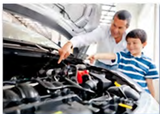
Mécanique automobile 汽车机械