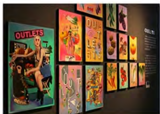
Décoration intérieure et présentation visuelle 室内装潢与视觉显示