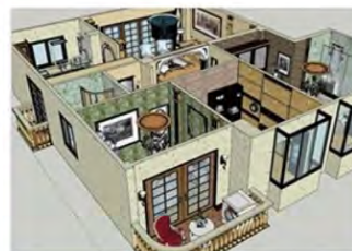
Dessin de bâtiment 住宅与商业制图