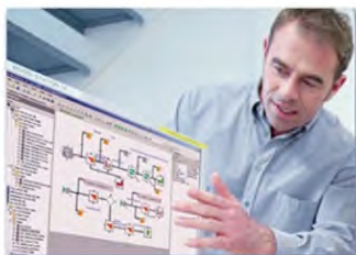
Soutien informatique 计算机支持