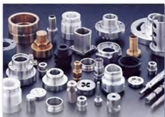
Technique d'usinage 机械加工技术