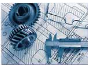
Dessin industriel 工业制图