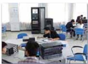
Installation et réparation d'équipement de télécommunications 通讯设备安装与维修