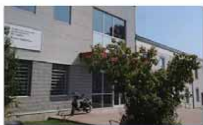
Centre de formation professionnelle Lachine