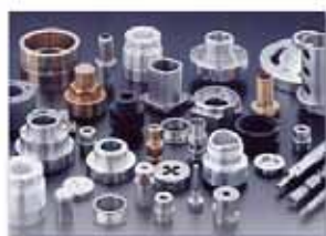
Technique d'usinage 机械加工技术