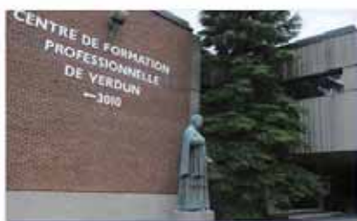
Centre de formation professionnelle Verdun