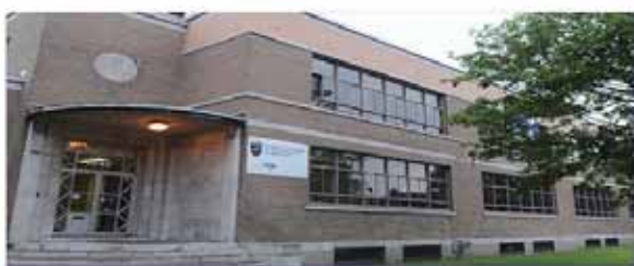
Centre de formation professionnelle des Carrefours