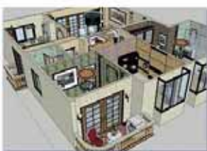
Dessin de bâtiment 住宅与商业制图