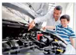
Mécanique automobile 汽车机械