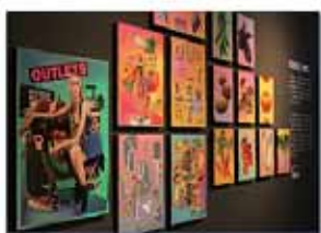
Décoration intérieure et présentation visuelle 室内装潢与视觉显示