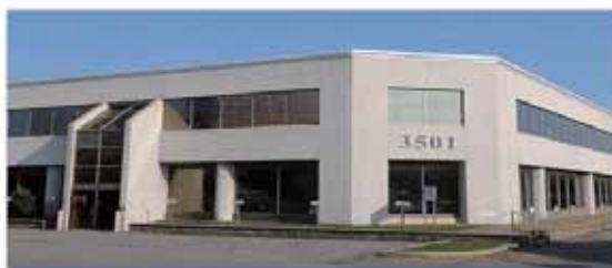
Centre de formation professionnelle des métiers la santé