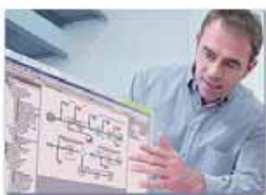
Soutien informatique 计算机支持