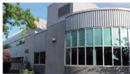
Centre intégré de mécanique, métallurgie et d'électricité (CIMME)