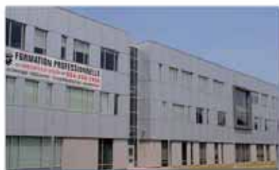
Centre de formation professionnelle Léonard-De Vinci-Saint-Laurent